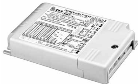
DC MAXI JOLLY US FP