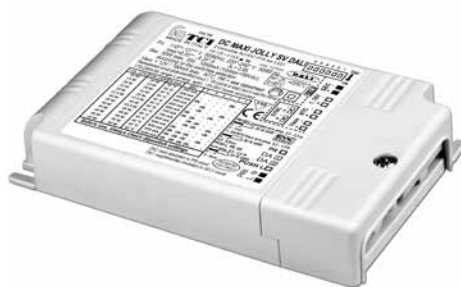
DC MAXI JOLLY SV DALI