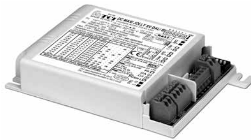
DC MAXI JOLLY SV DALI BI