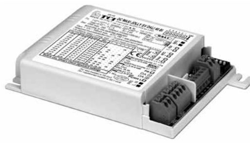
DC MAXI JOLLY SV DALI 40 BI