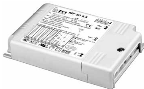
MP 50 K3

Multipower LED drivers Alimentatori LED multipotenza