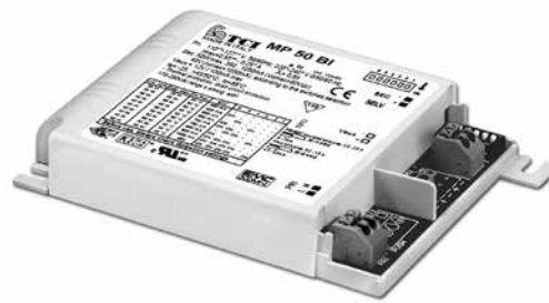
MP 50 BI