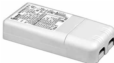
UNIVERSALE 20 LC

Multipower LED drivers Alimentatori LED multipotenza