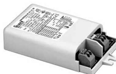
UNIVERSALE 20 LC BI